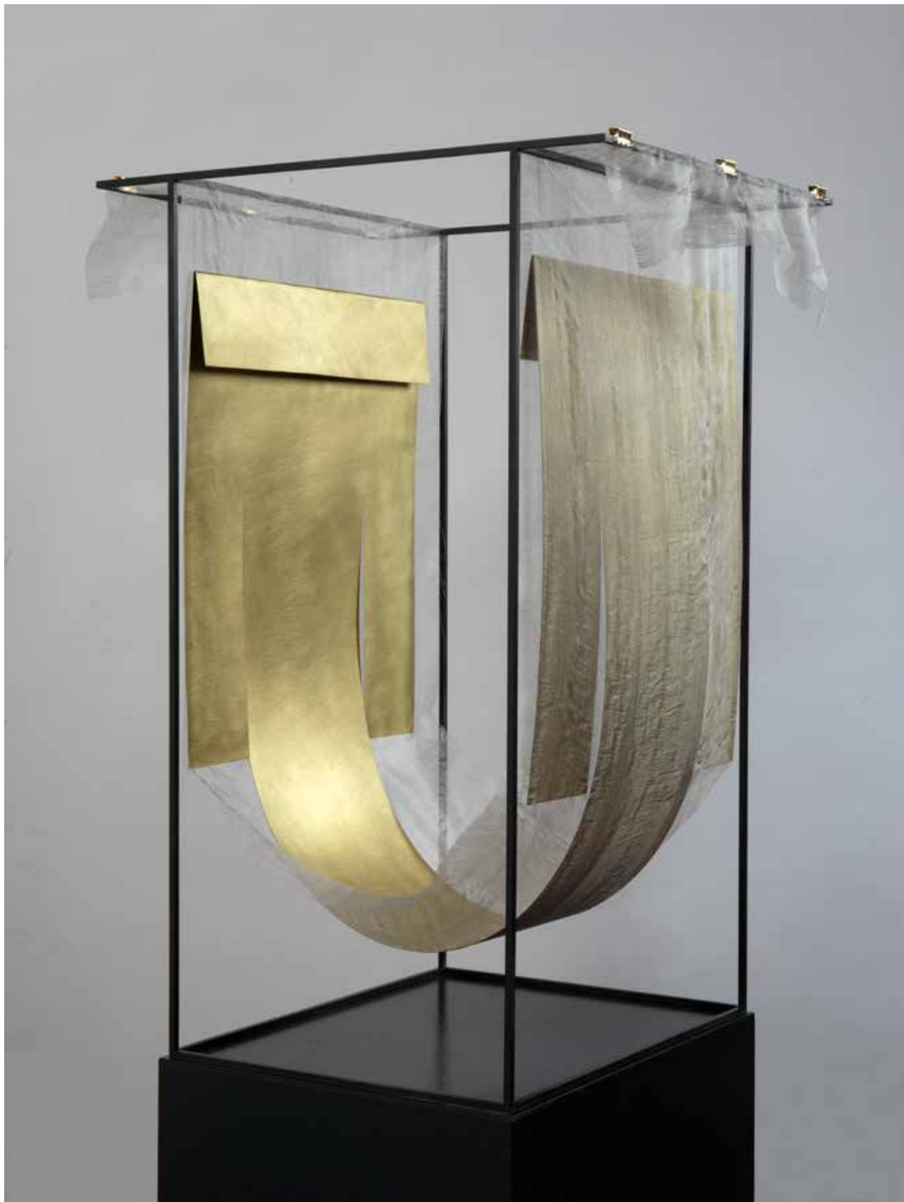
KIMONO / KIMONO. rézlemez, selyemgéz, acél, 71 x 41 x 32,5 cm, 2021