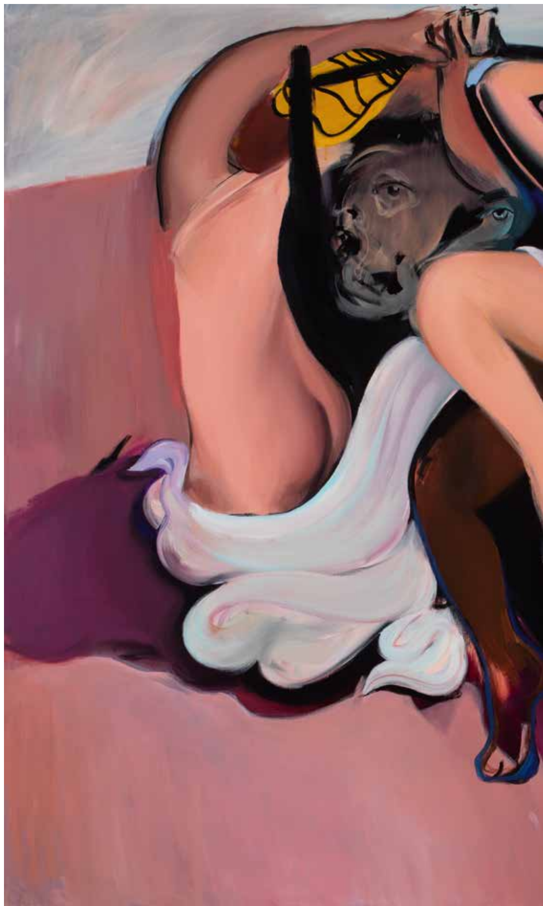
ÖRÖKKÉ VÁGYAKOZVA 4., akril, vászon, 155 x 185 cm, 2023