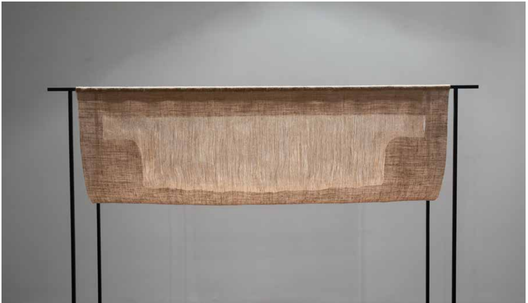
A HIÁNY JELENLÉTE / THE PRESENCE OF ABSENCE. acél, jutavászon, 162 x 180 x 40 cm, 2021