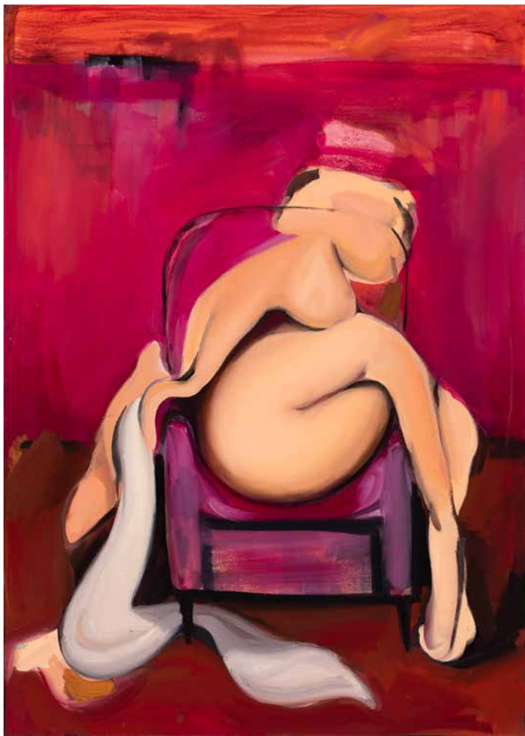
A SZERELEM SZERETI SZERETNI A SZERELMET 3., akril, olaj, vászon, 70 x 50 cm, 2022