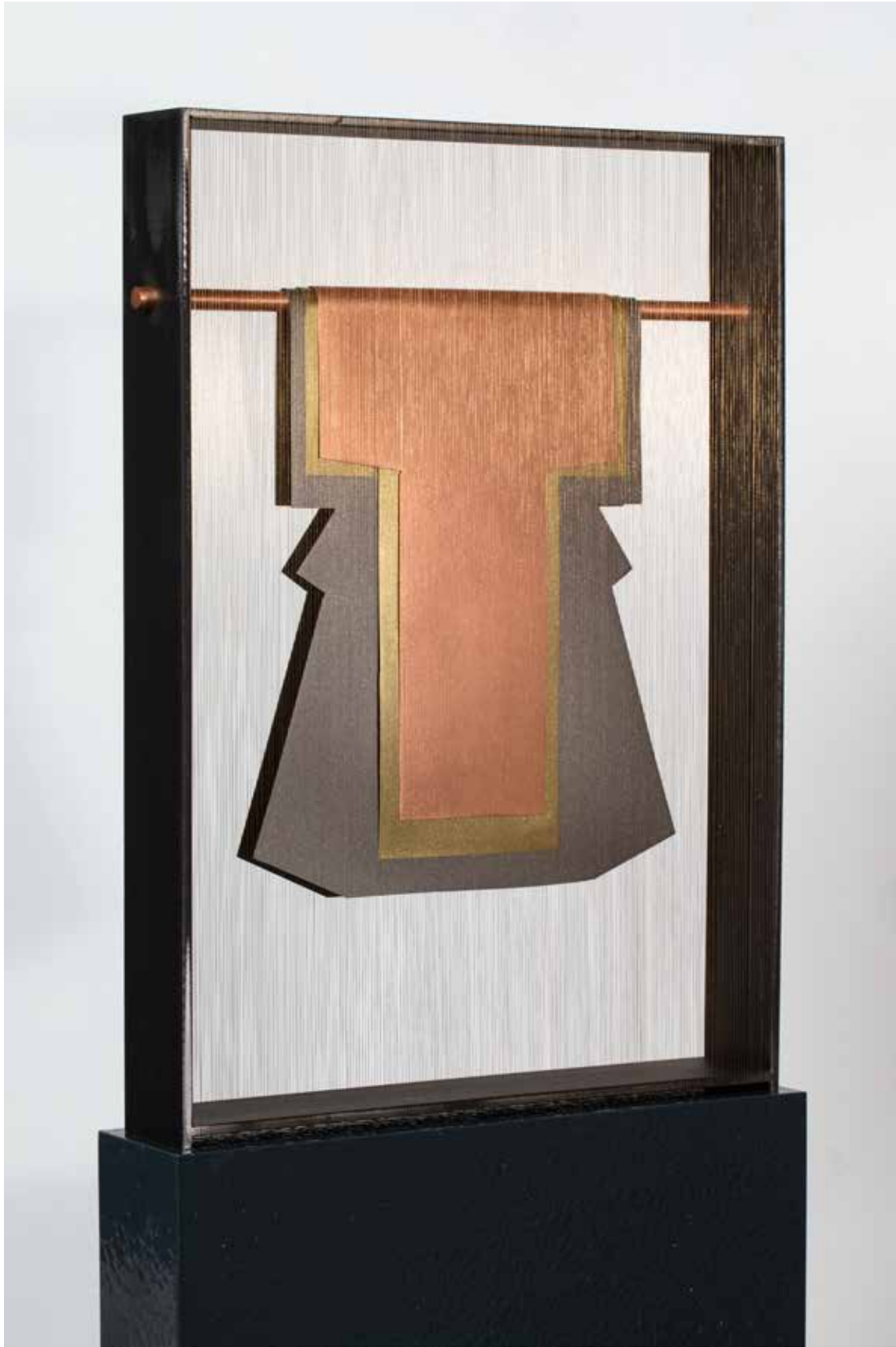
HITOE/KIMONO LAYERS. acél, rézlemez, hímzőcérna, 48 x 33 x 6 cm, 2023