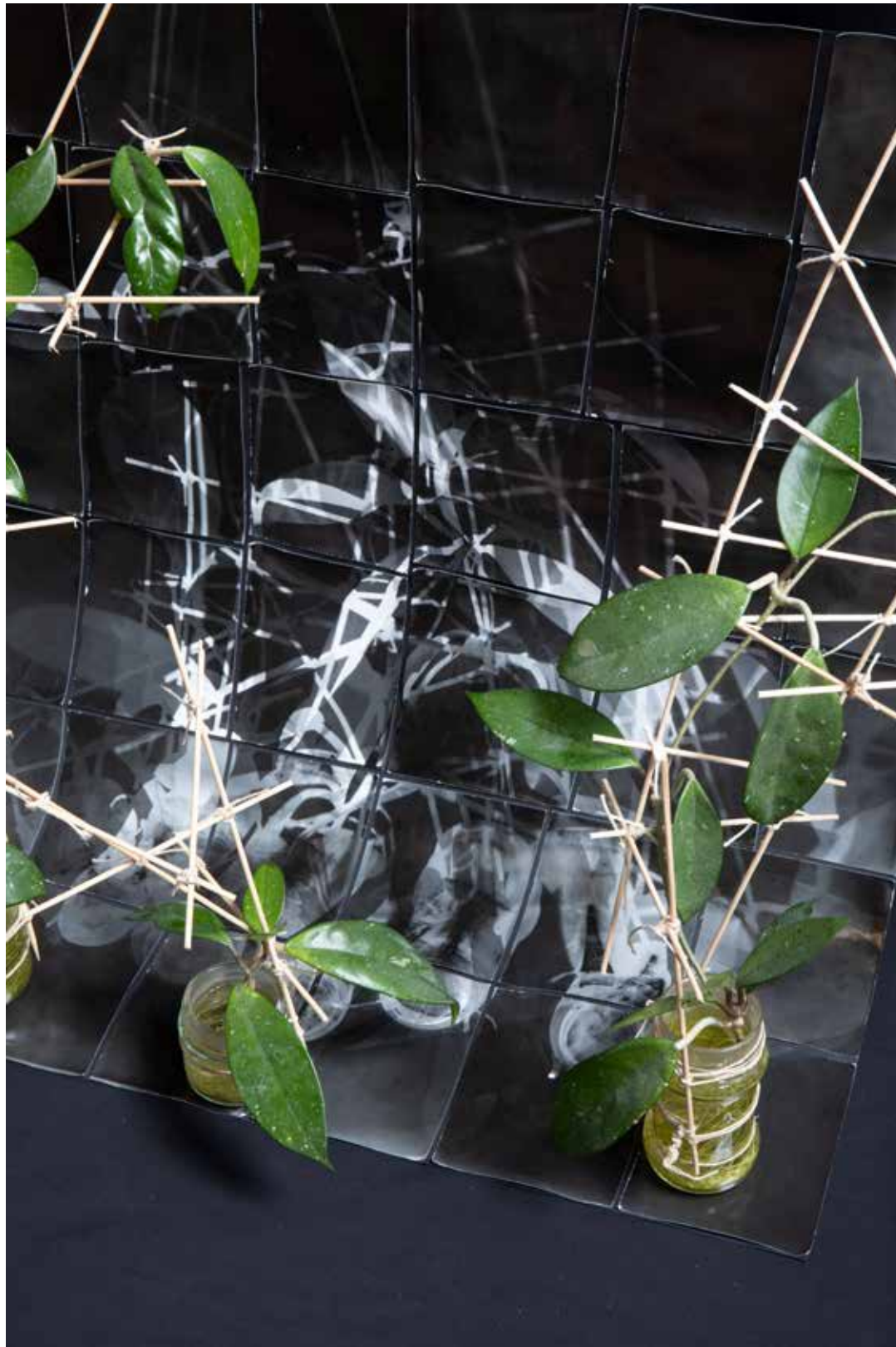
SOME OF PURE WATER (részlet) ezüst zselatin nyomat, (36 darab, együtt 73 x 62cm), 2021/2022 gyökerező viaszvirágok, zsinór, hurkapálca, üveg, víz és só