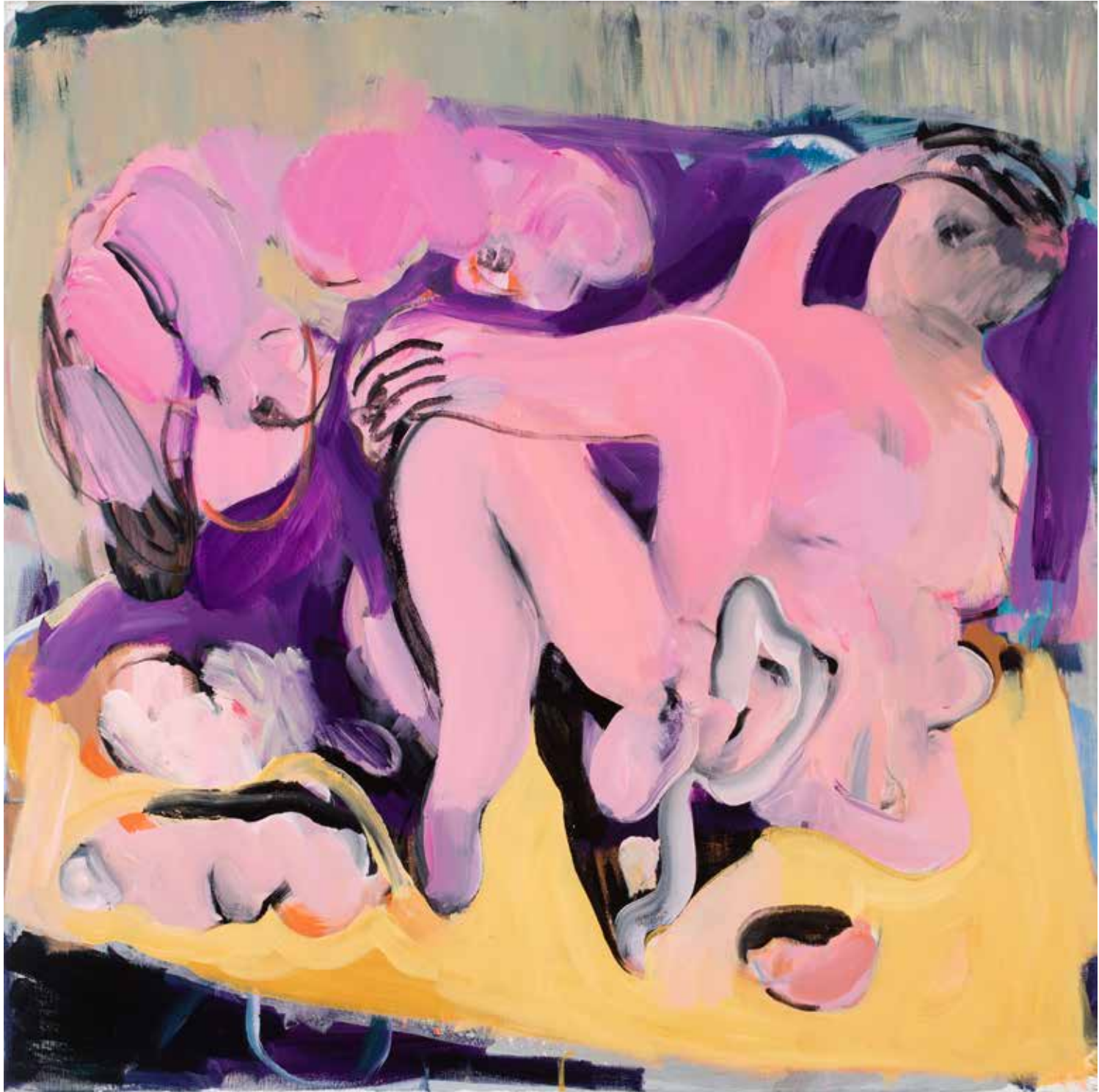
KIÖMLÖTTÜNK A FÖLDRE #9, akril, vászon, 90 cm x 90 cm, 2022