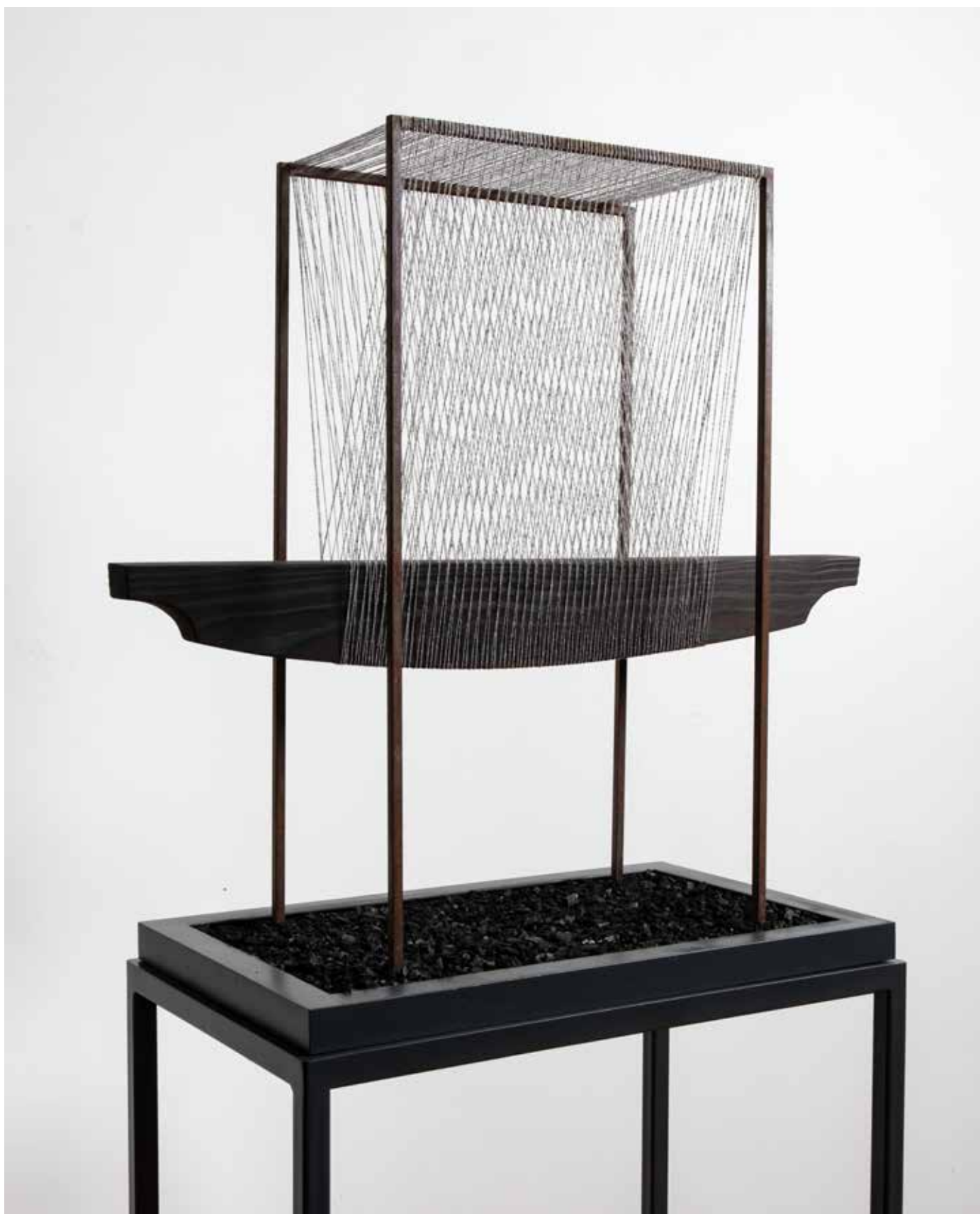
FÜGGŐBEN HAGYVA / MEANING SUSPENDED. acél, fa, selyemfonal, faszén, 62 x 66 x 31 cm, 2021