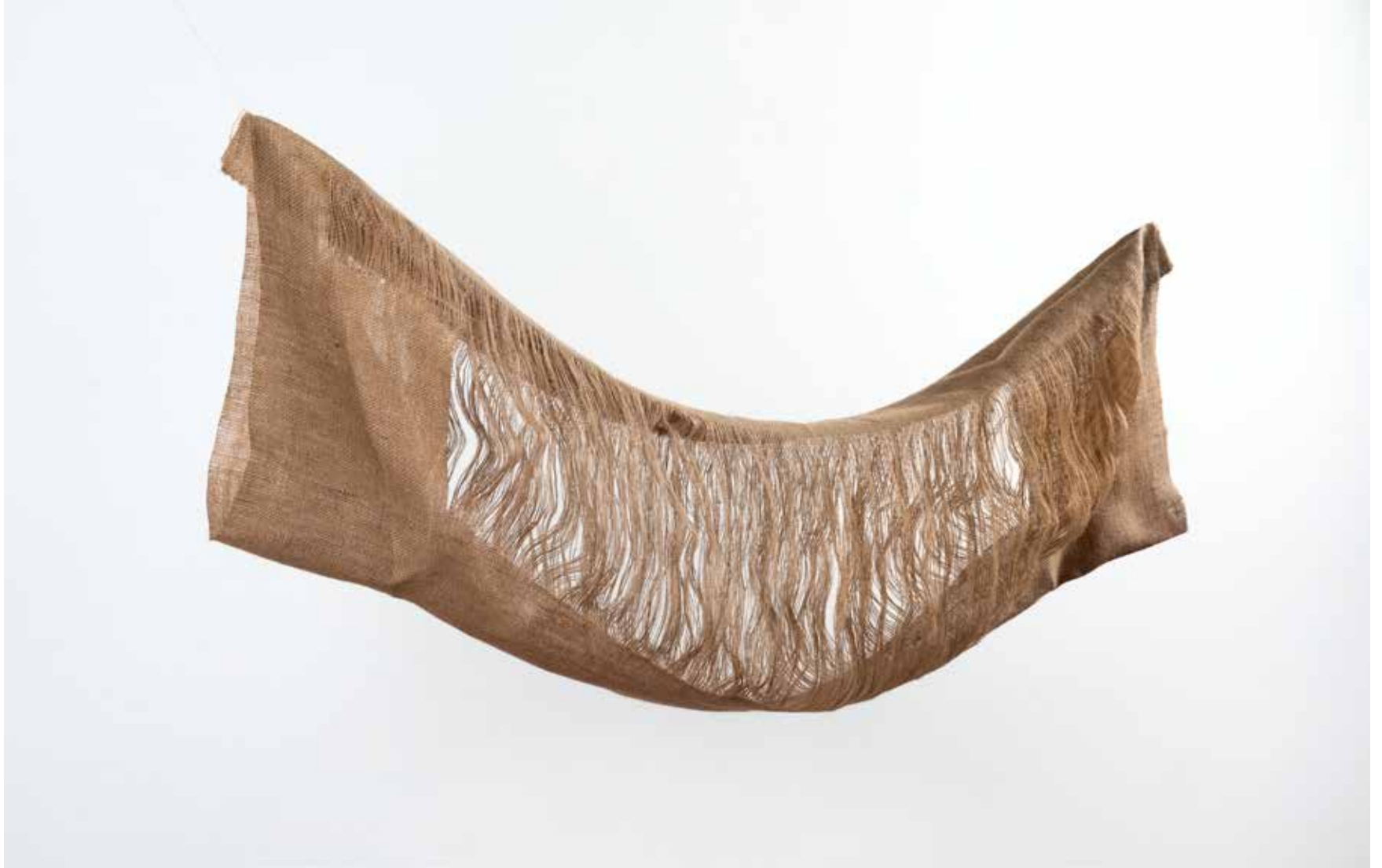
TÉRSZÖVET / THE FABRIC OF SPACE. jutavászon, 50x150 x 30 cm, 2021