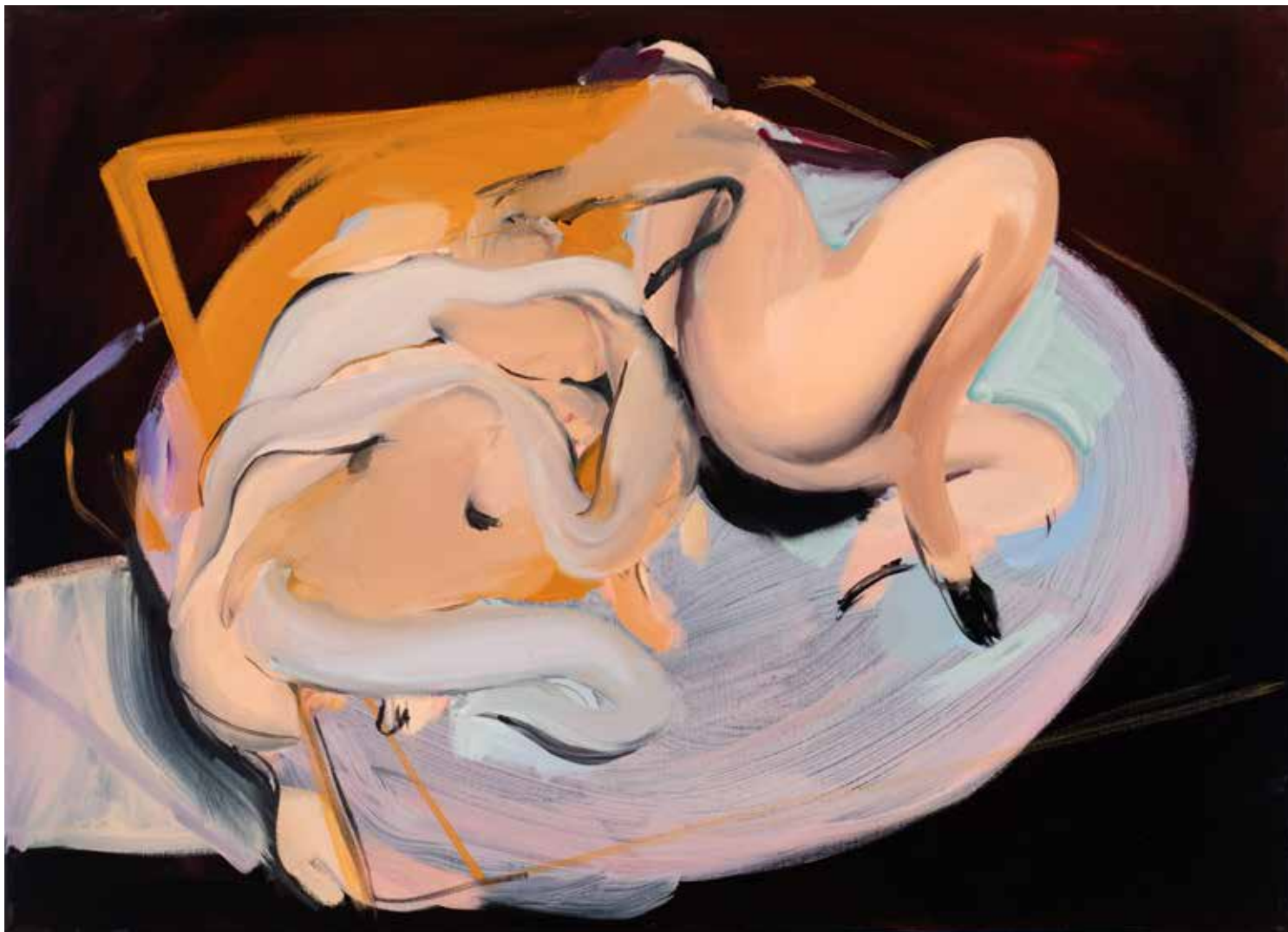
ÖRÖKKÉ VÁGYAKOZVA 2., akril, olaj, vászon, 50 x 70 cm, 2022