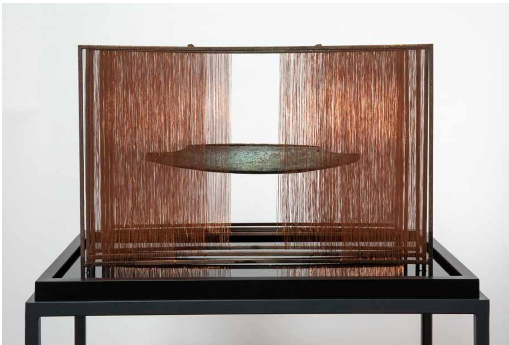
UKI / LEBEGÉS / FLOATING. acél, réz, bronz, víz, olaj, 35 x 66 x 38 cm, 2021