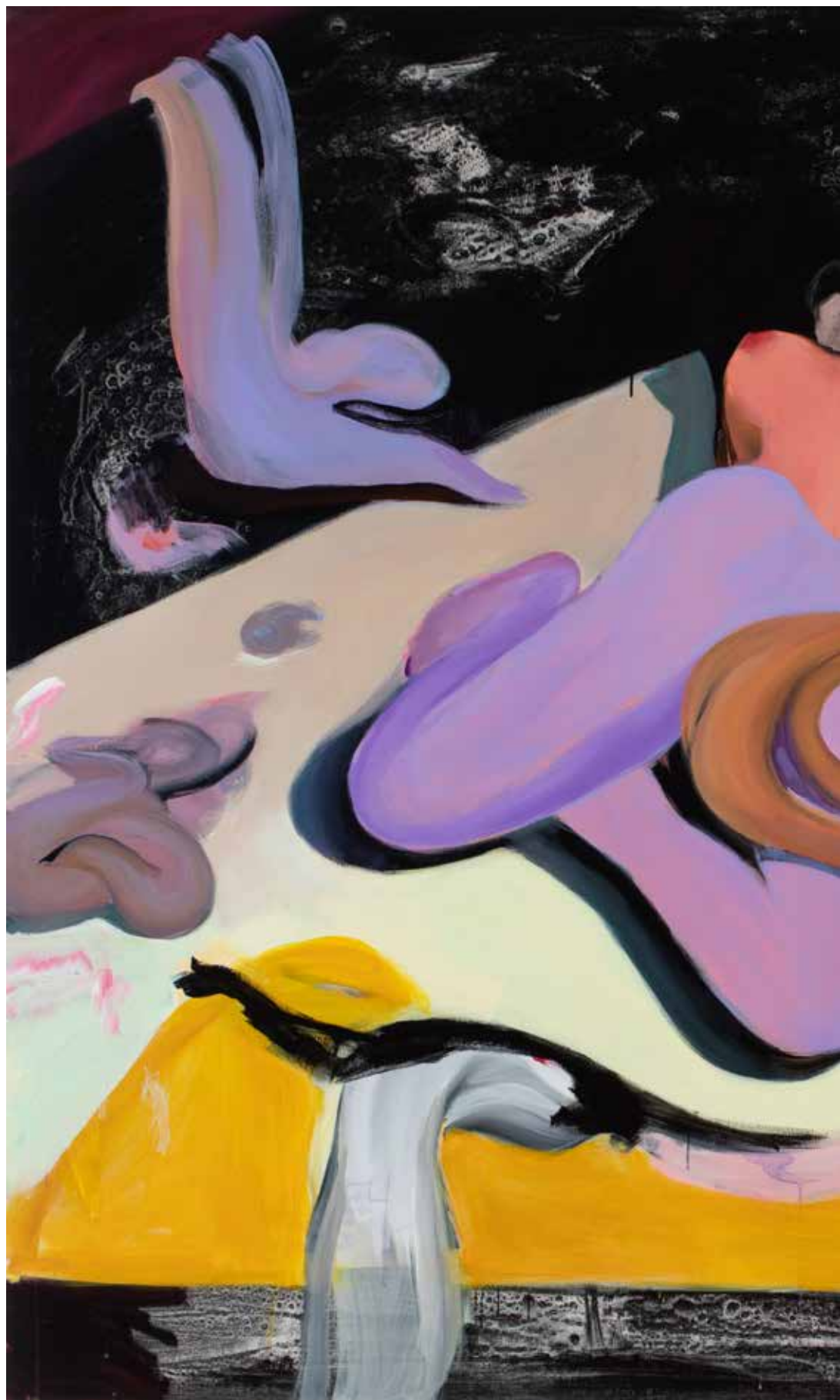
MIND MEGETTE 2., akril, vászon, 155 x 185 cm, 2023