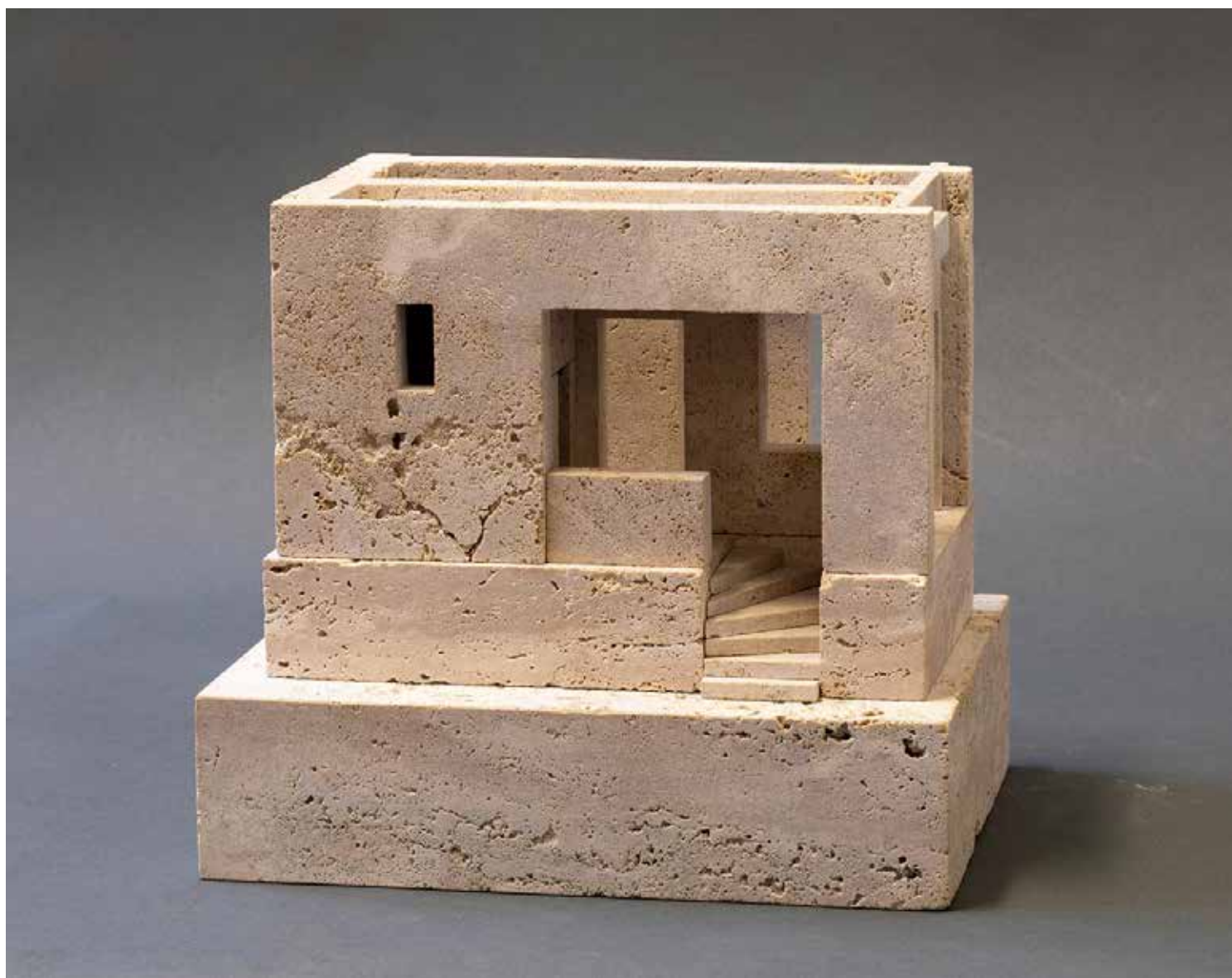
VILLA NEGRA mésző, 40 × 20 × 30 cm, 2024