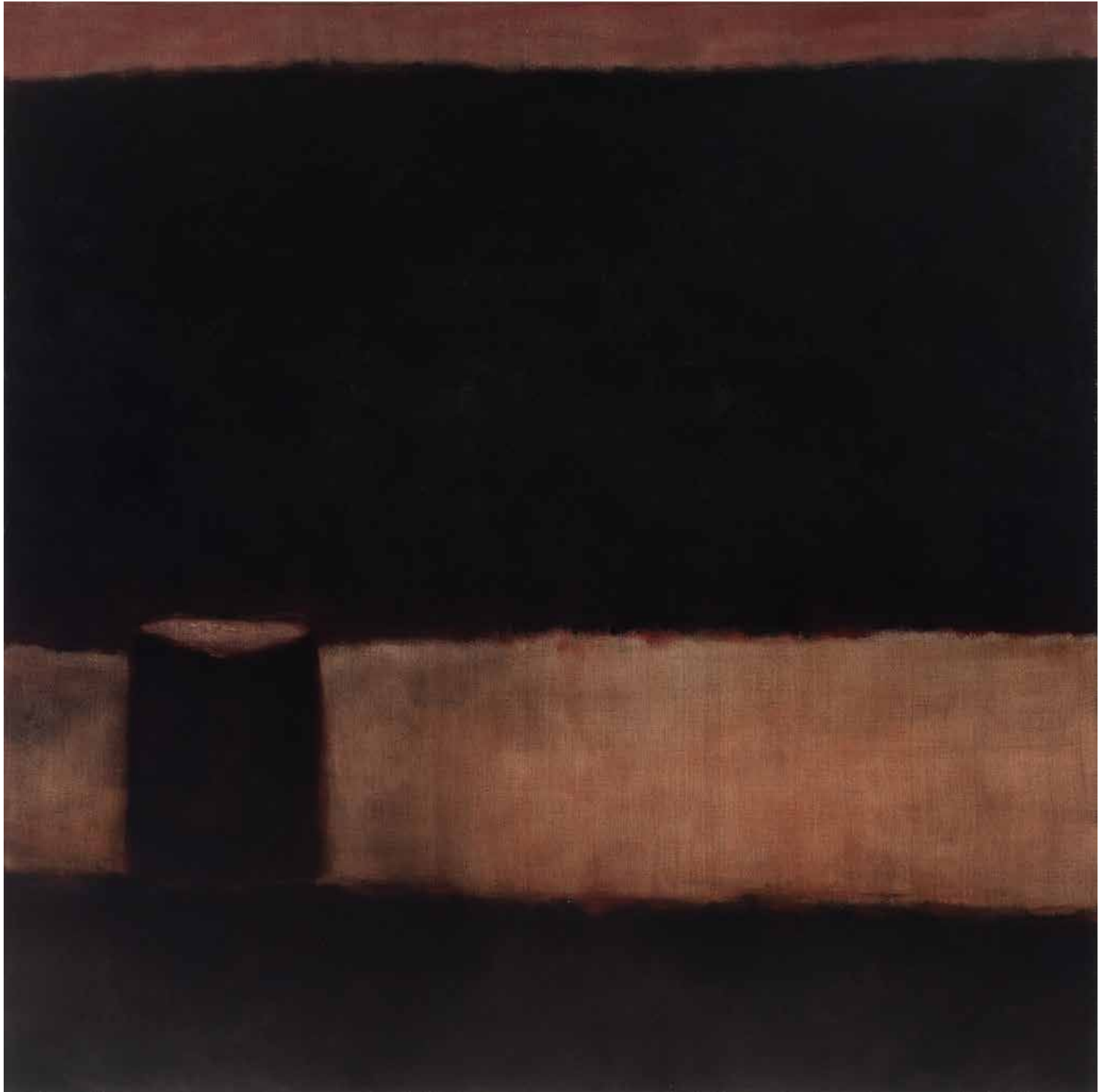
JULIA CSENDJE olaj, lenvászon, 130 × 130 cm, 2024