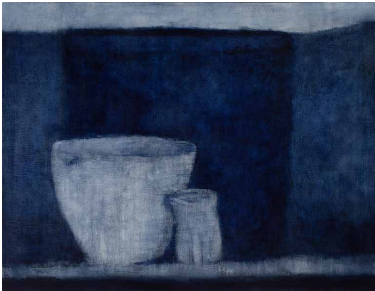
KÉK EVANGÉLIUM-CSEND olaj, lenvászon, 100 × 130 cm, 2024