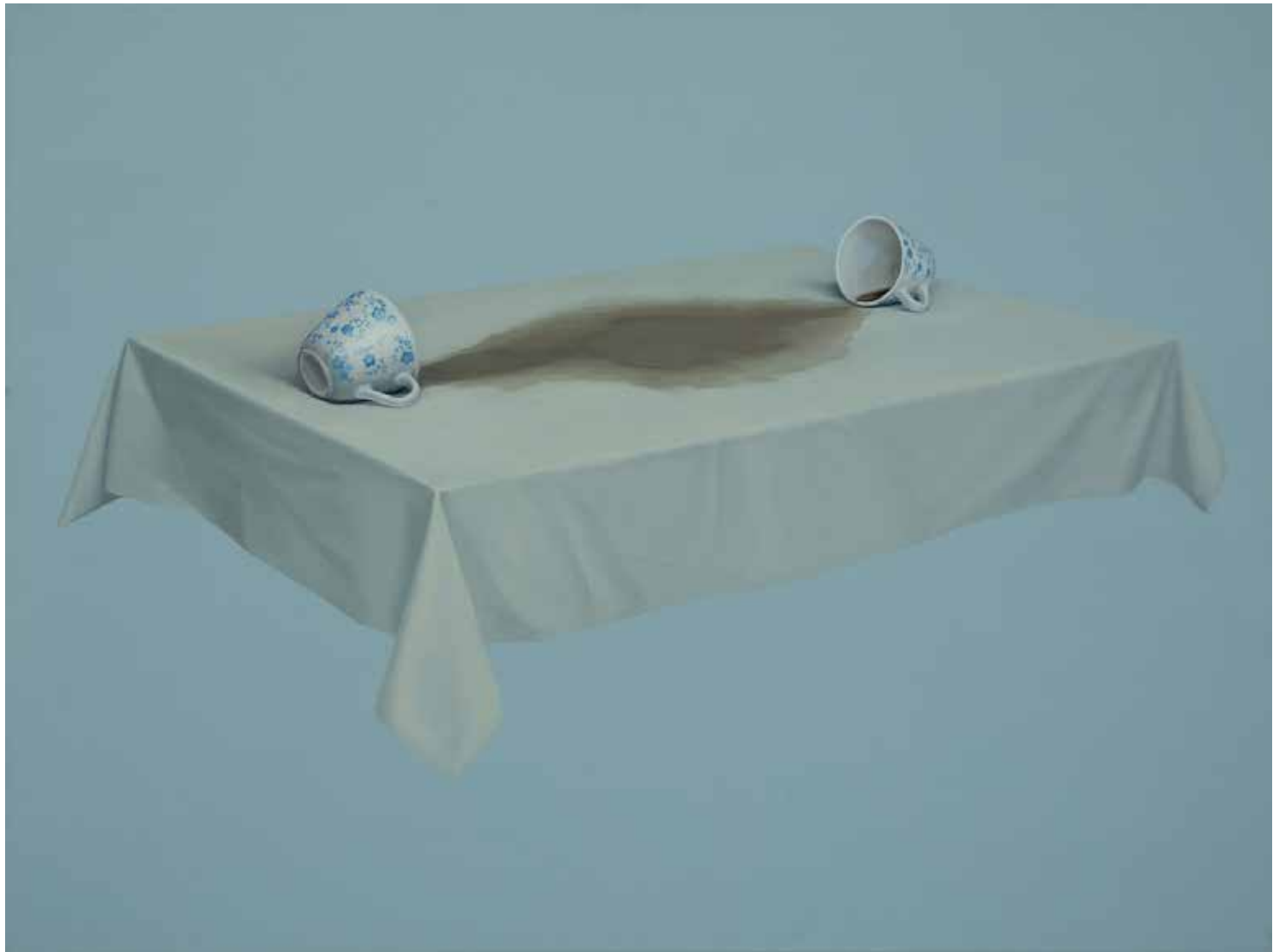
SZINKRONICITÁS olaj, vászon, 100 × 150 cm, 2024