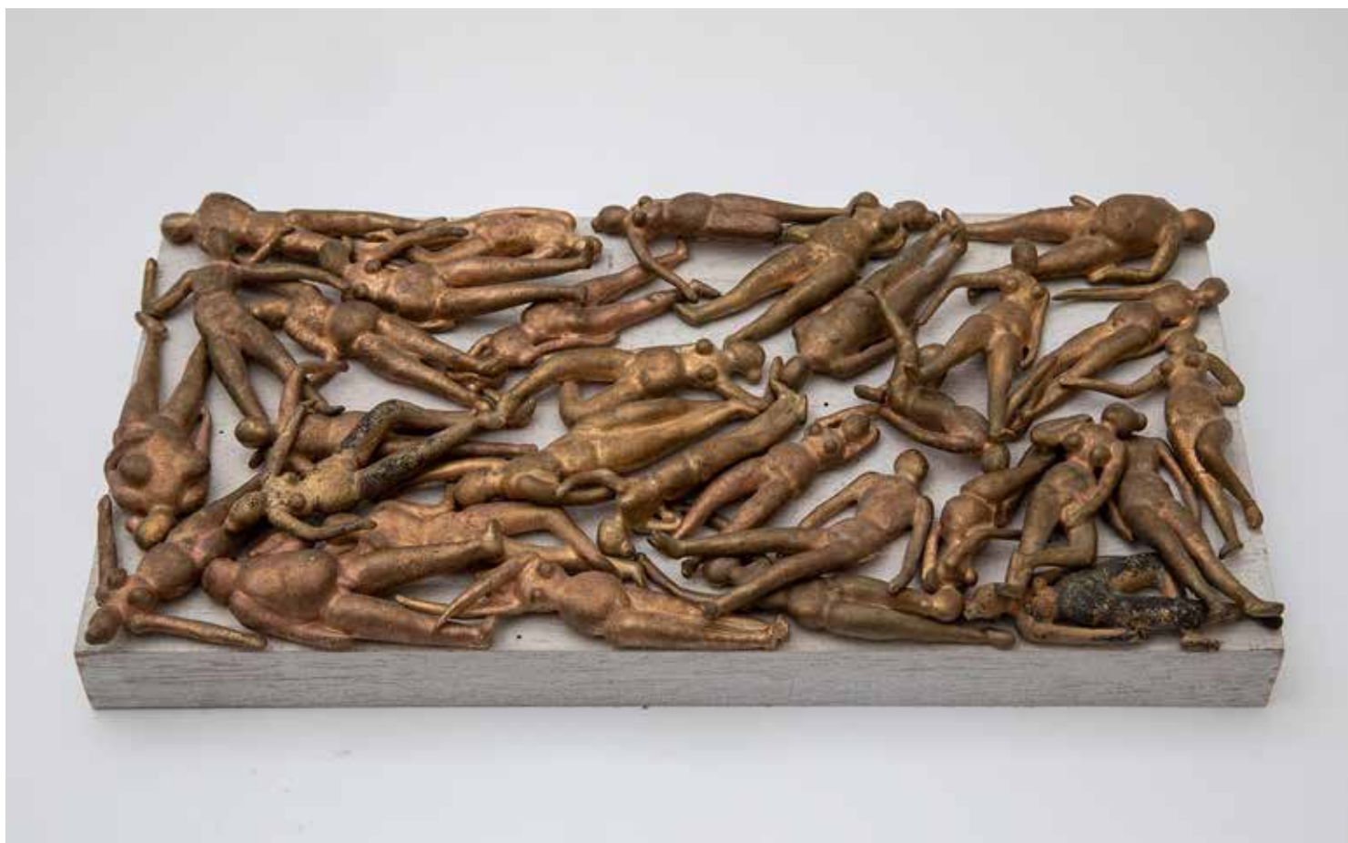
TÖMEGSÍR bronz, fa, 40 × 20 × 3,5 cm, 2022