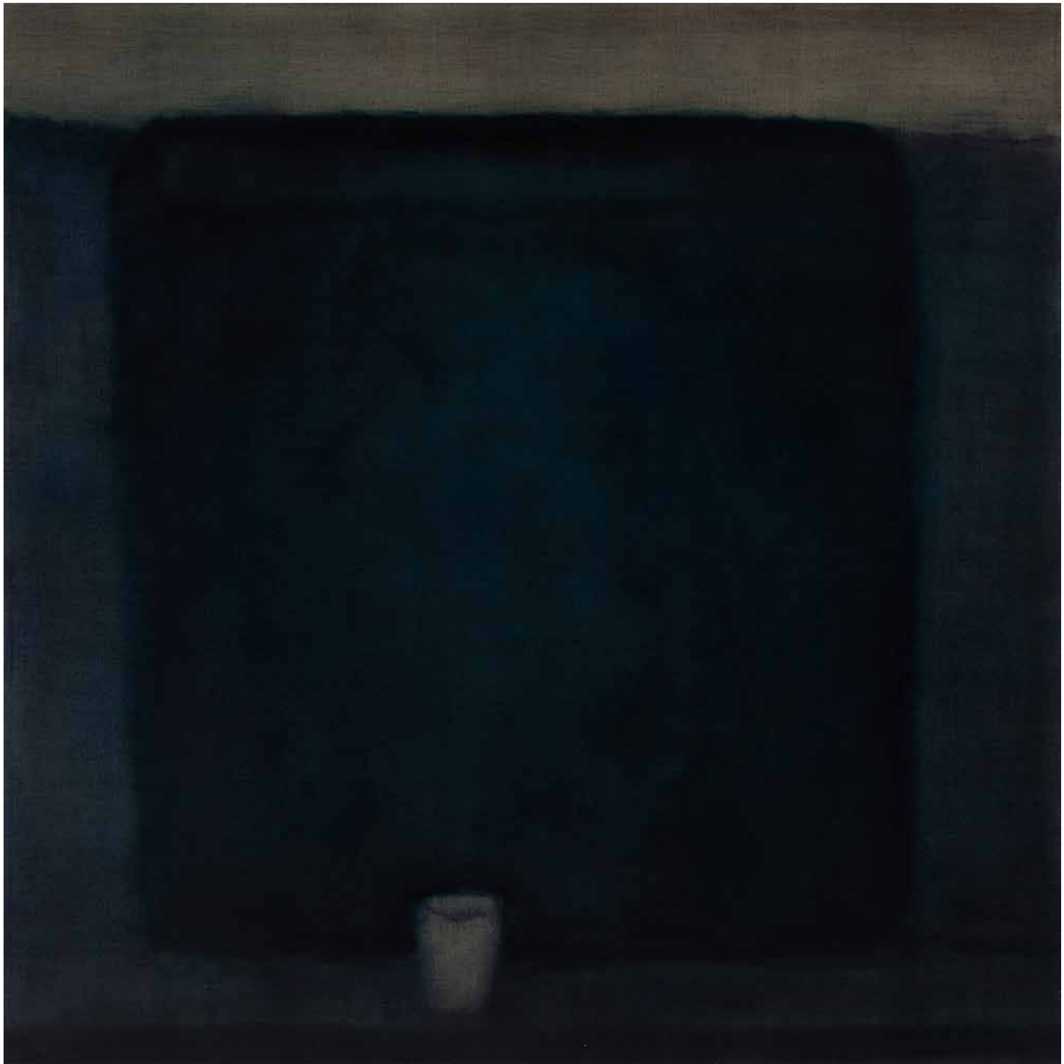
MÉLYSÉGES-CSEND olaj, lenvászon, 130 × 130 cm, 2024