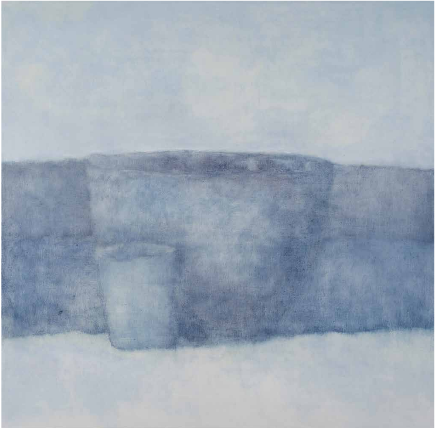
TENGER-CSEND olaj, lenvászon, 130 × 130 cm, 2024