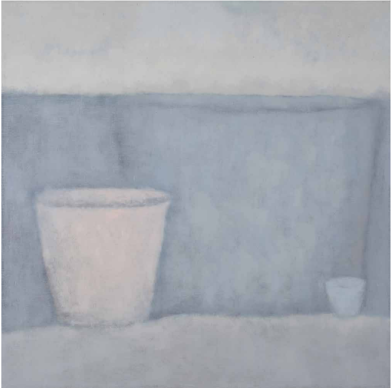
LA FÉE-CSEND olaj, lenvászon, 130 × 130 cm, 2024