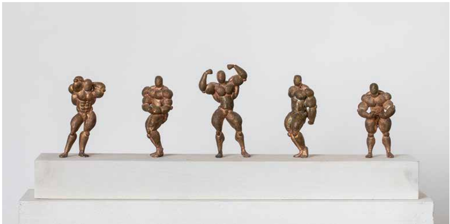
TESTÉPÍTŐ EMLÉKMŰ bronz, fa, 50 × 12 × 8 cm, 2021