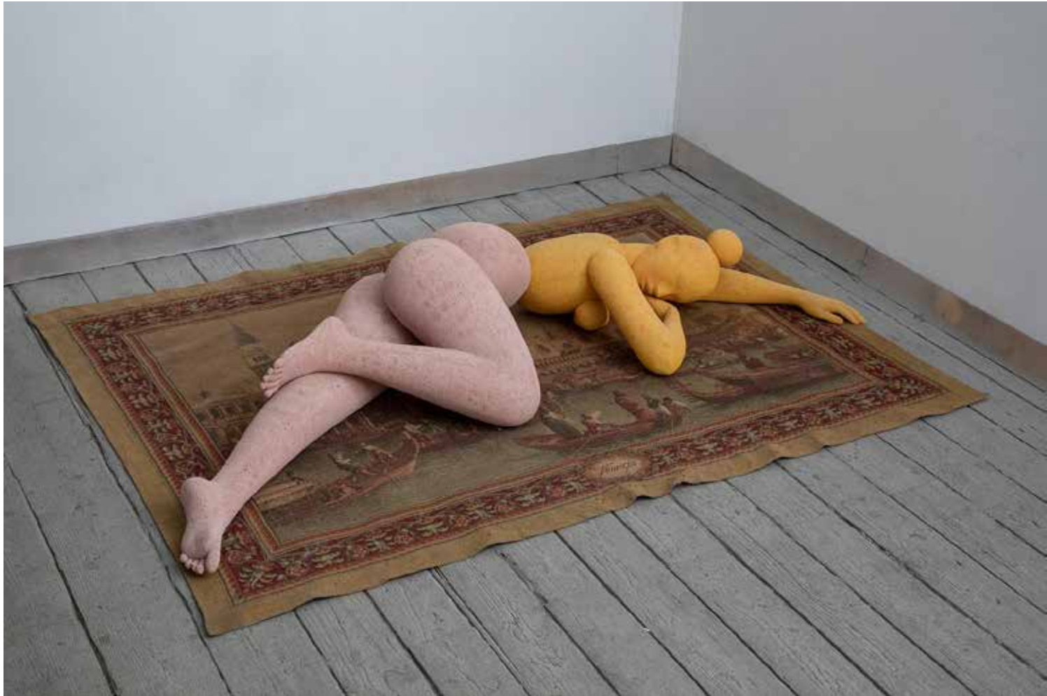
VELENCEI ÁLOM purhab, 200 × 100 × 45 cm, 2023