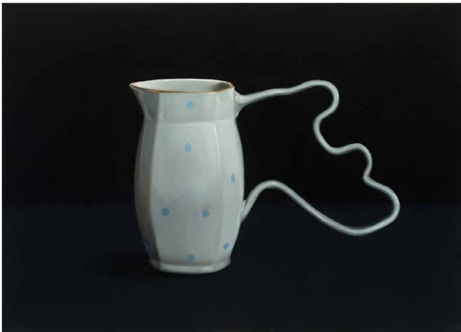
ÉJSZAKA FELSZABADULNAK A TÁRGYAK I. olaj, vászon, 50 × 70 cm, 2025