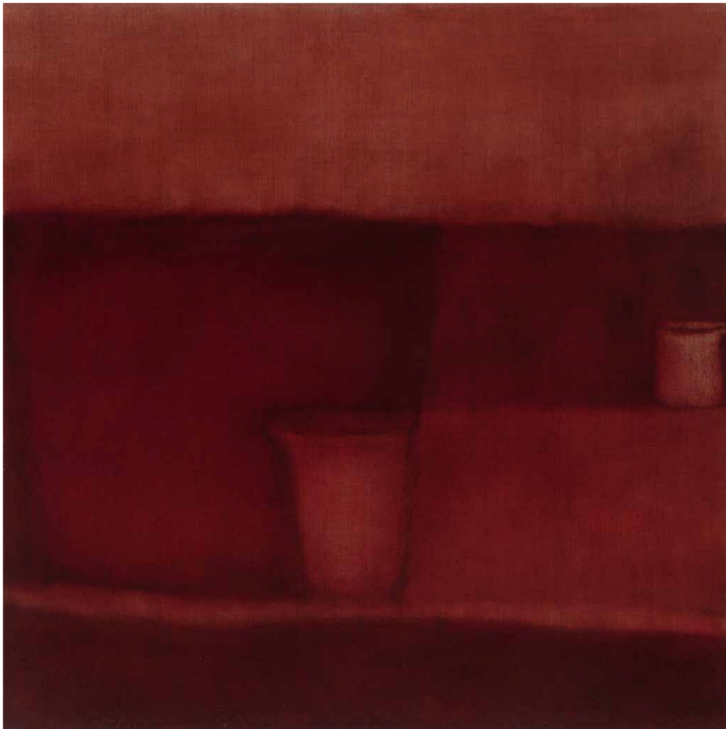
VÖRÖS TÉVEDÉS-CSEND olaj, lenvászon, 100 × 100 cm, 2024