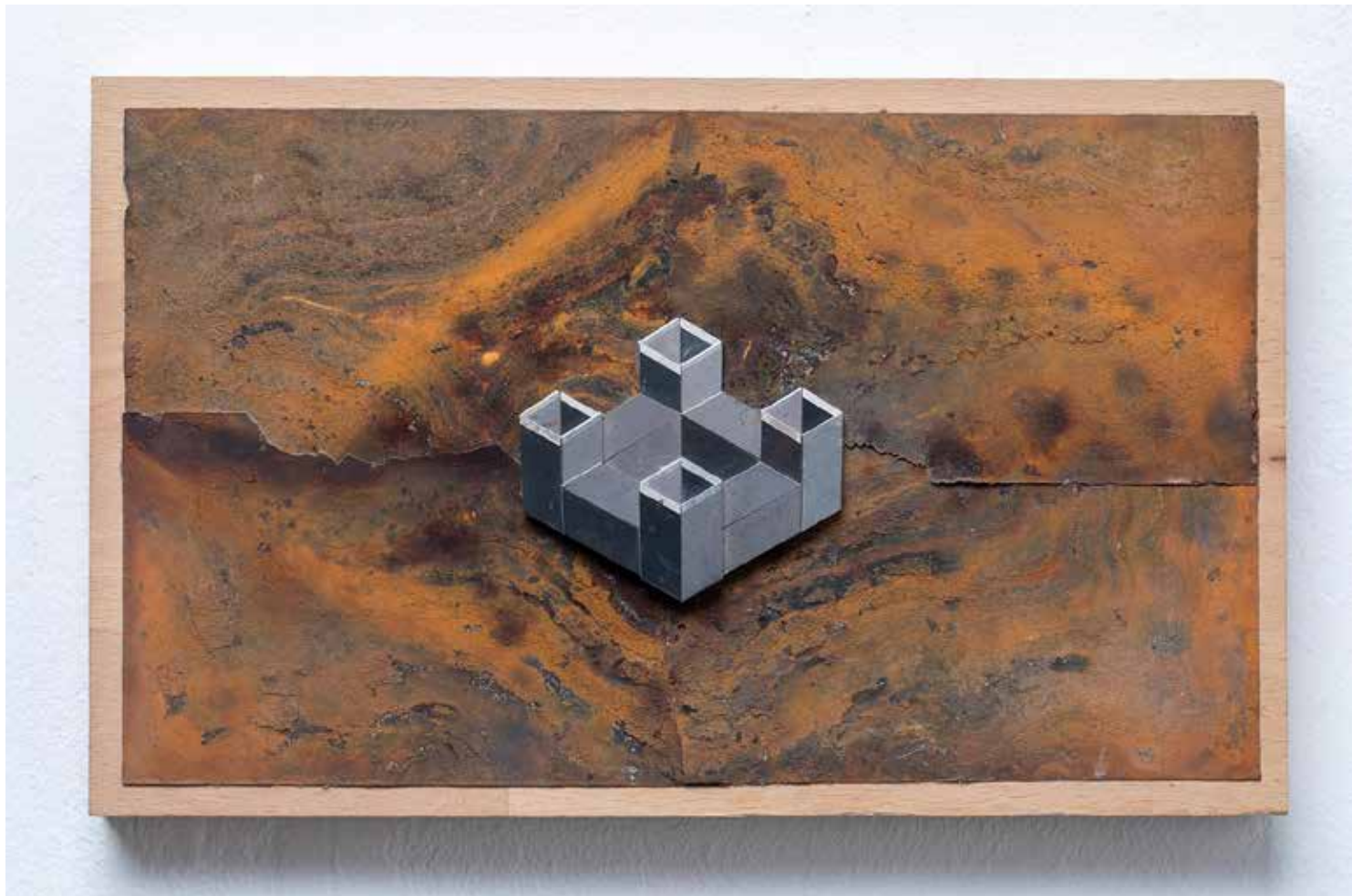
ÉGI ERŐD acél, rozsdá, dekorlemez, 23 × 12 × 2 cm, 2022