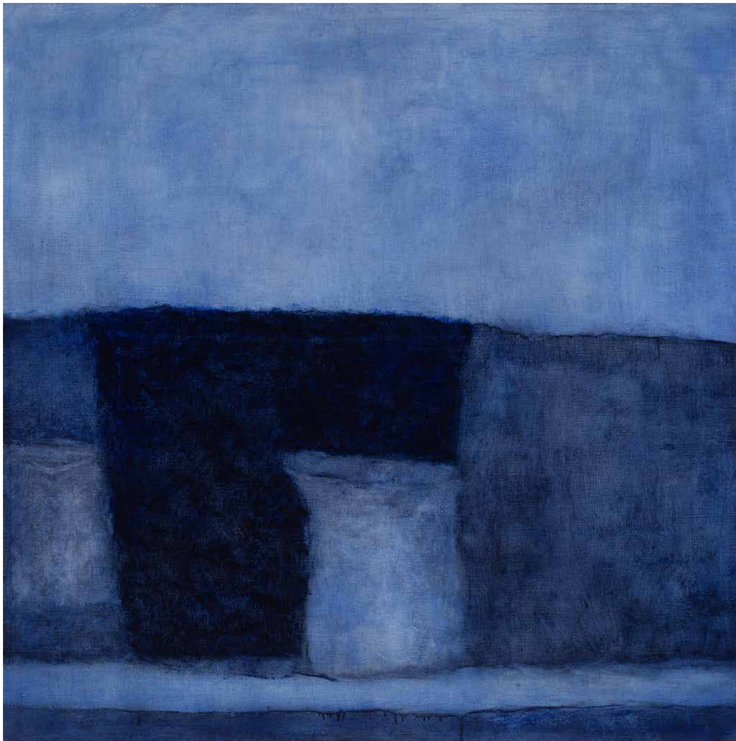
MISERERE MEI-CSEND olaj, lenvászon, 100 × 100 cm, 2025