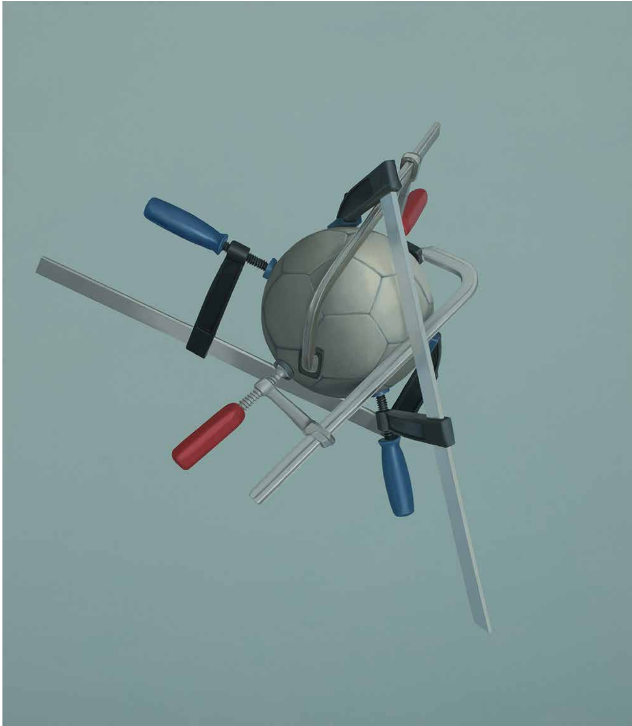
SZORÍTUNK olaj, vászon, 158 × 138 cm, 2020