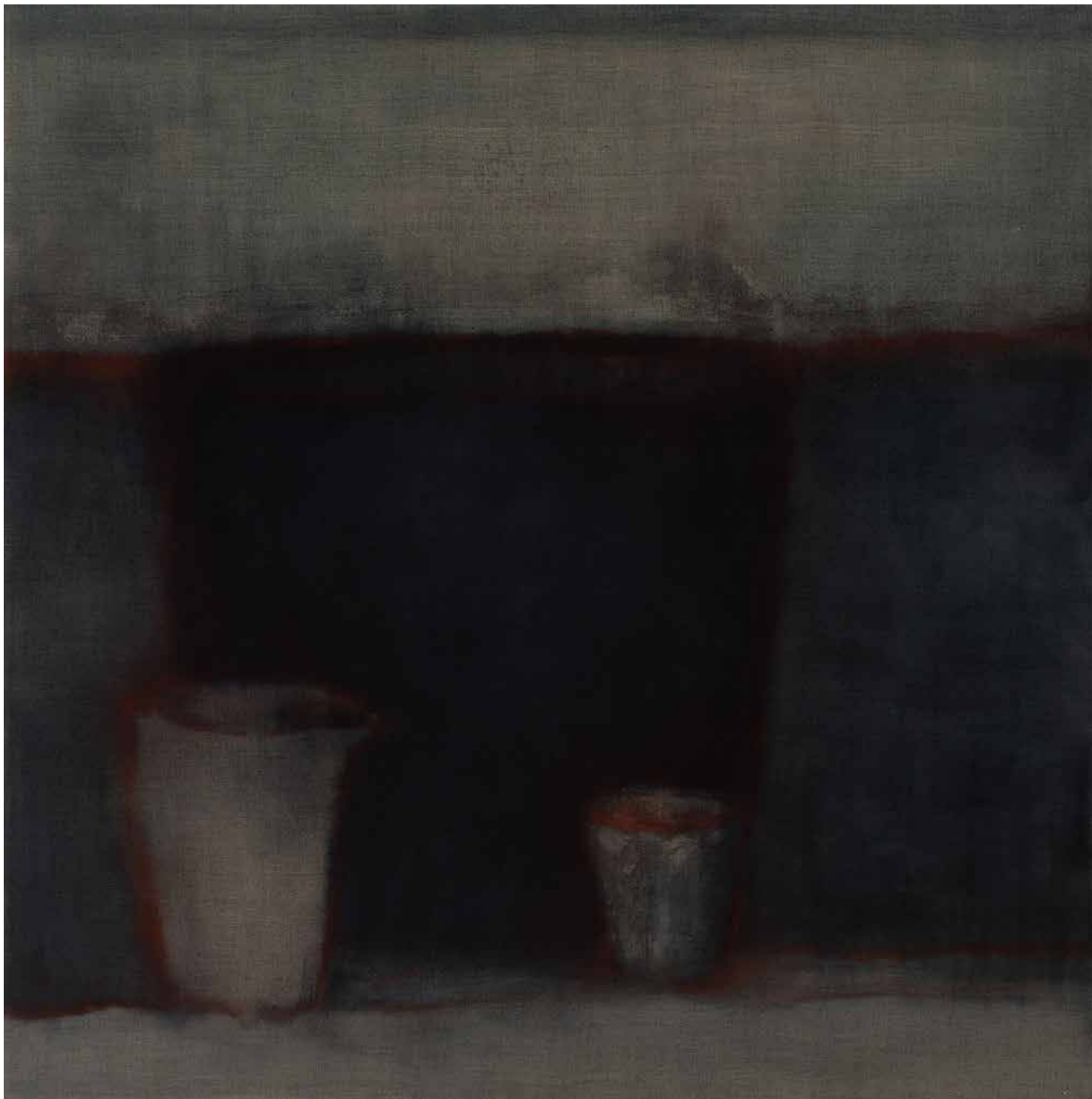
BEFEJEZHETETLEN-CSEND olaj, lenvászon, 130 × 130 cm, 2024