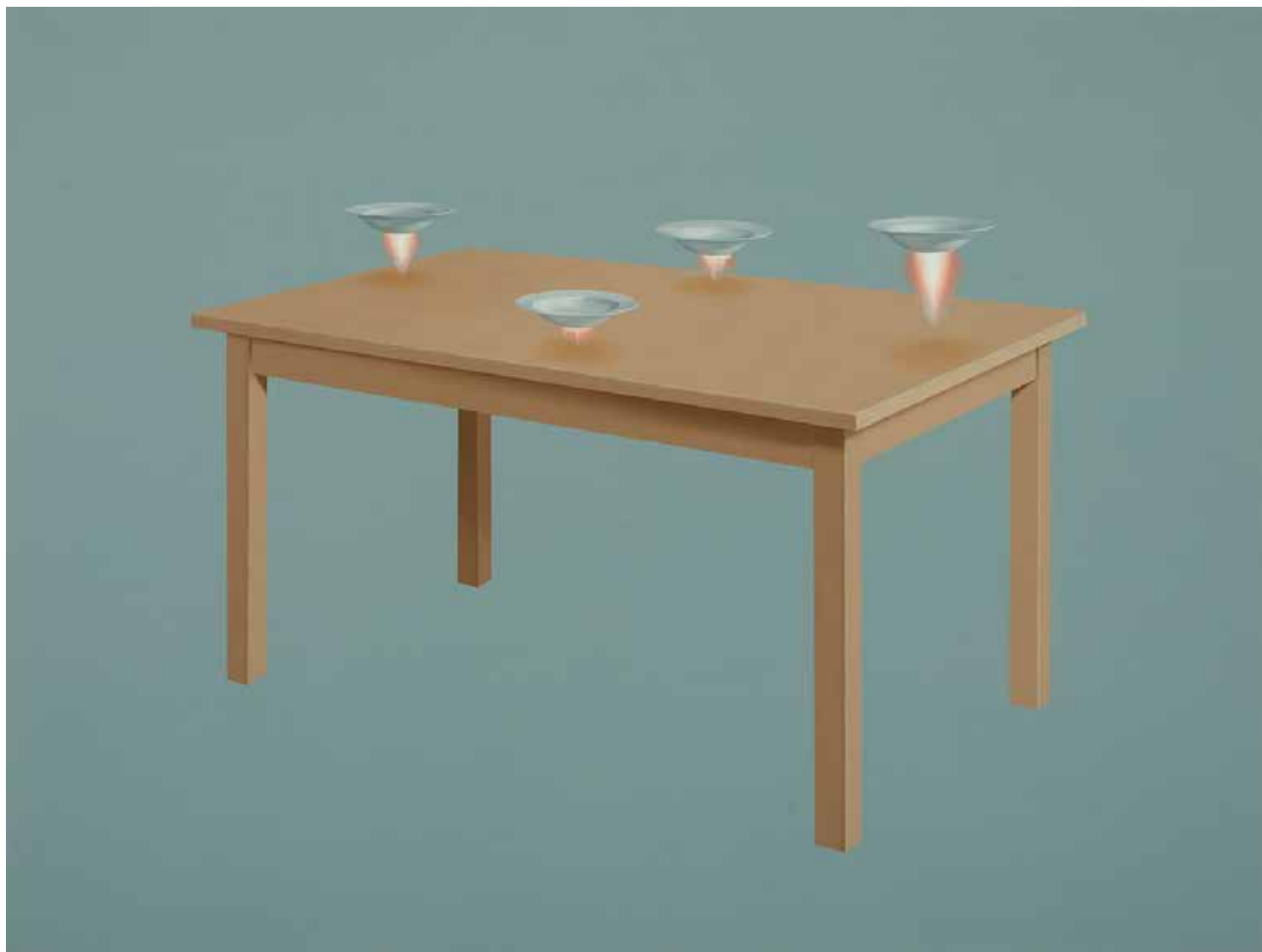
ASZTAL I. olaj, vászon, 150 × 200 cm, 2020