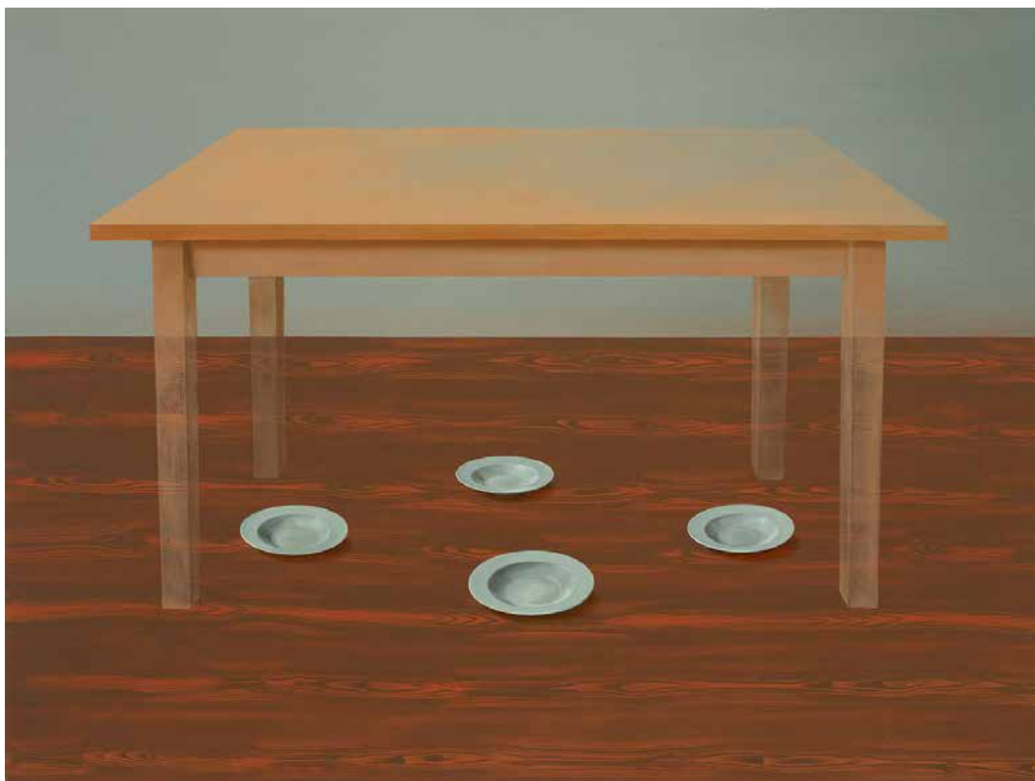
MINDEN RENDBEN VAN V. olaj, vászon, 150 × 200 cm, 2019