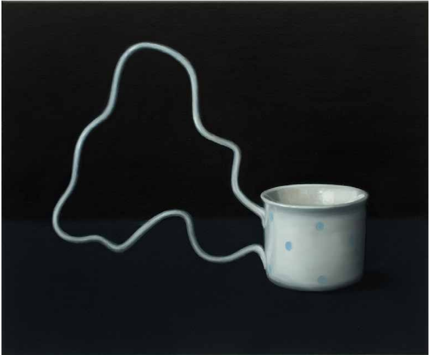
ÉJSZAKA FELSZABADULNAK A TÁRGYAK II. olaj, vászon, 50 × 60 cm, 2025