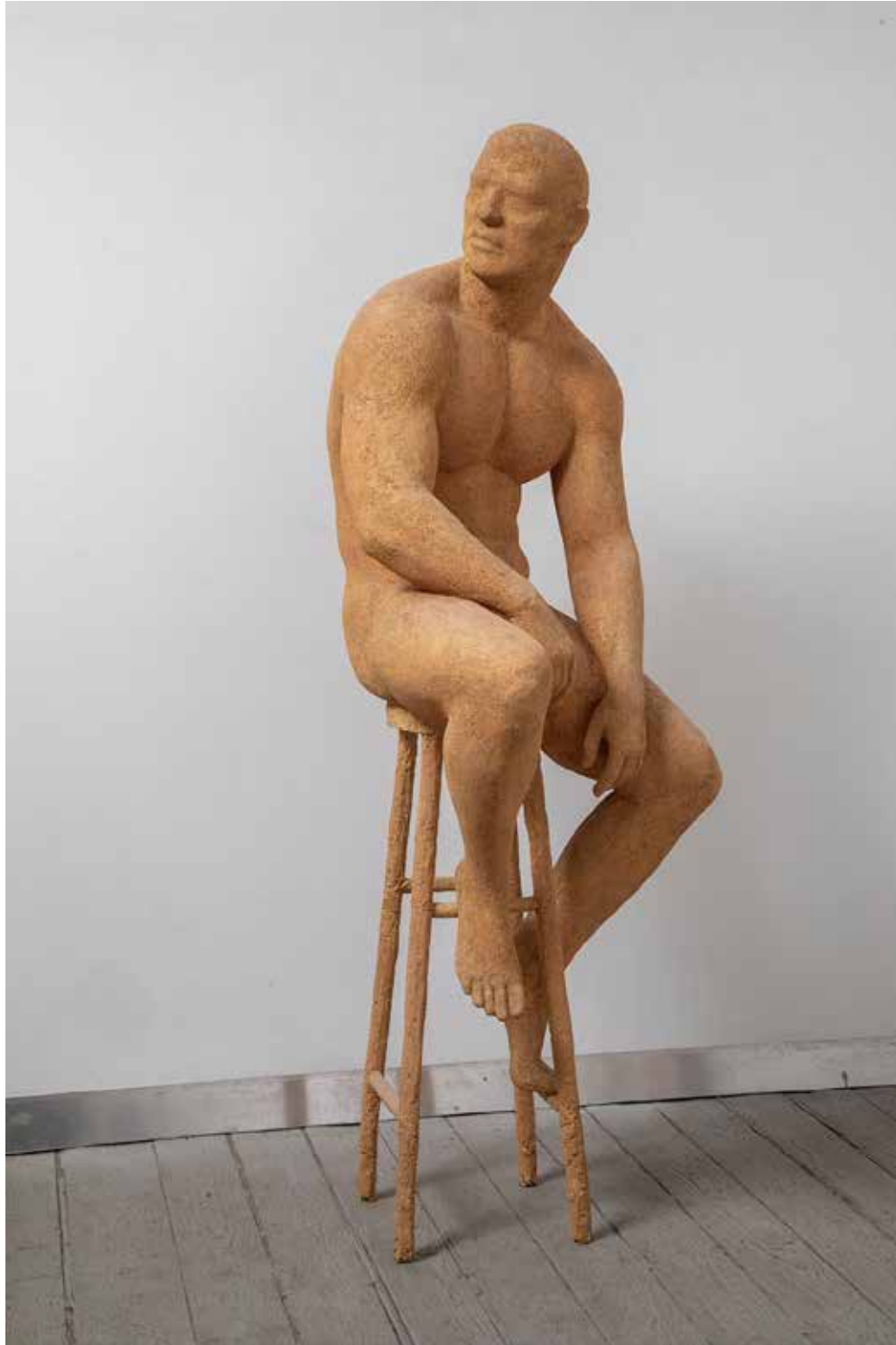
BUCIFEJ purhab, 170 × 60 × 60 cm, 2022