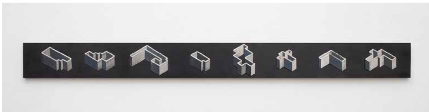
DOBOZVARIÁCIÓK I. acél, dekorlemez, 80 × 10 × 1,5 cm, 2022