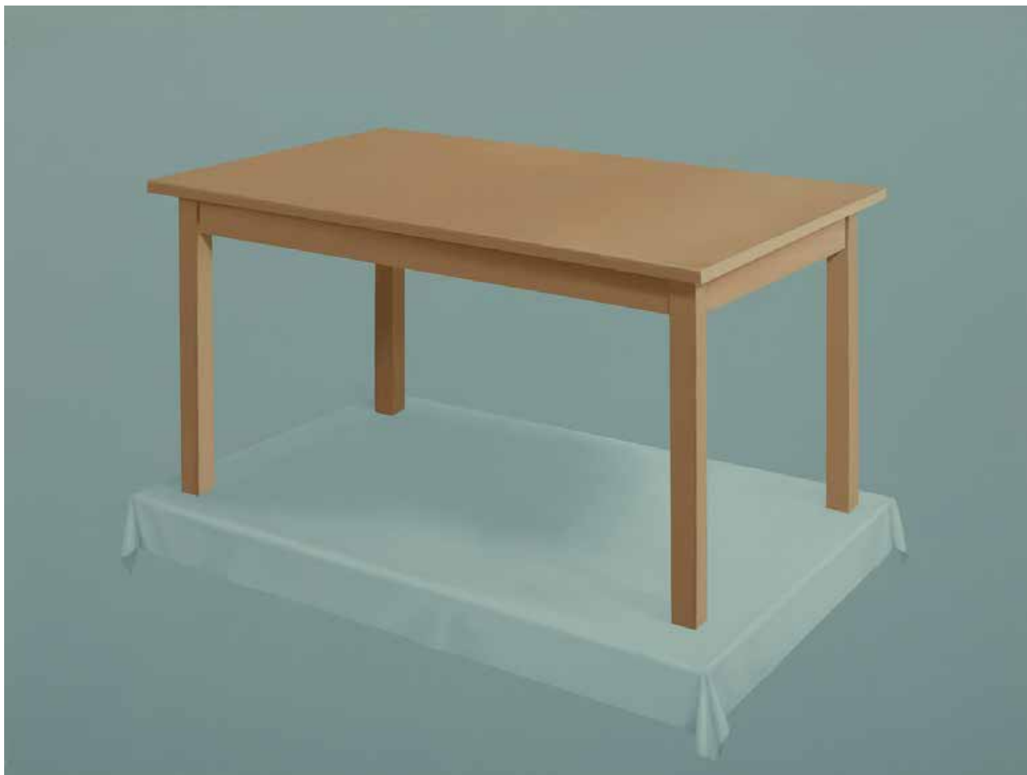
ASZTAL III. olaj, vászon, 150 × 200 cm, 2020