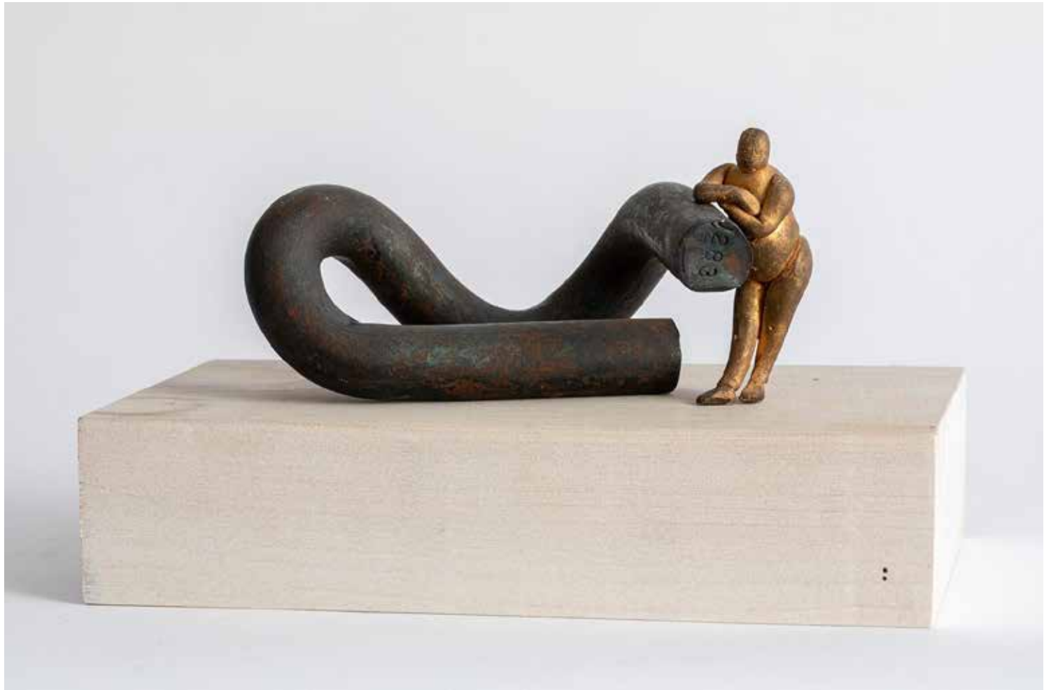
HOMMAGE Á EDUARDO CHILLIDA bronz, vas, fa, 30 × 13 × 13 cm, 2022