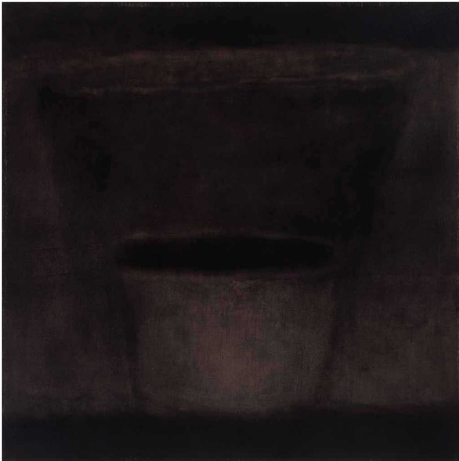
KAPELLE-CSEND olaj, lenvászon, 100 × 100 cm, 2025