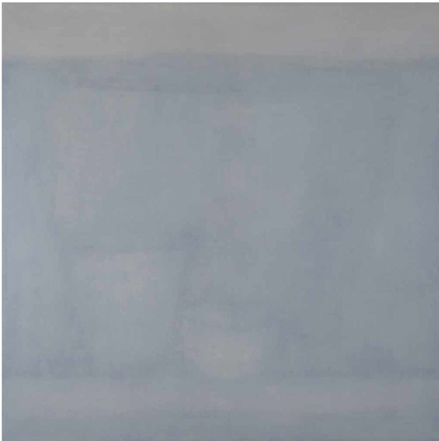
FEHÉR-CSEND olaj, lenvászon, 130 × 130 cm, 2024