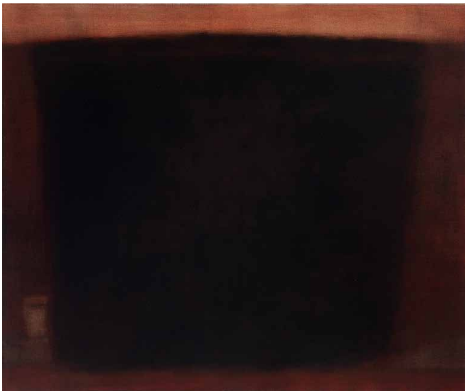
ELNÉMULT-CSEND olaj, lenvászon, 110 × 120 cm, 2024